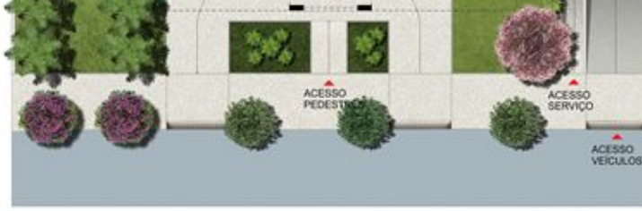
Imóveis na planta BH