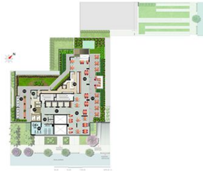
Flats na planta Savassi